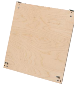
wall hanging plate